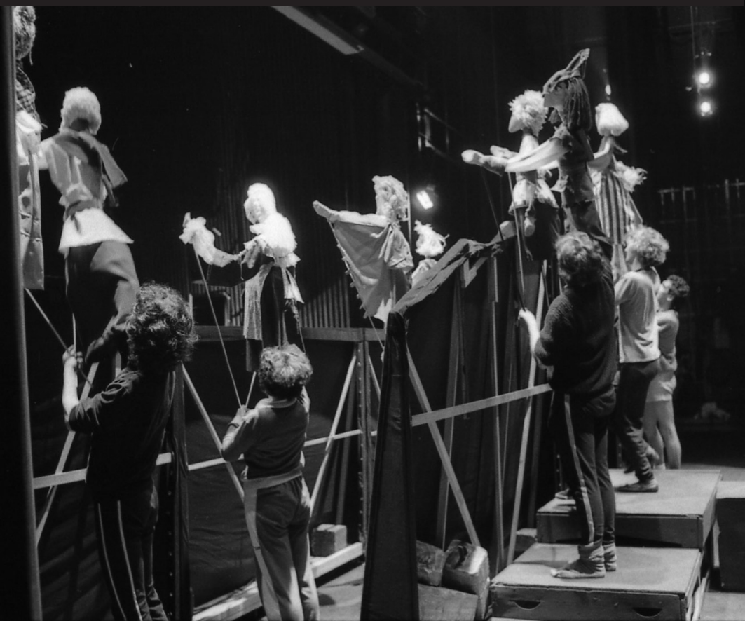
Los titiriteros manejando los muñecos entre bambalinas.